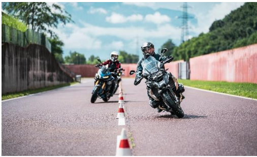
Abbildung 3: Weitläufiges Fahrgelände für professionelles Training und umfassendes Modelltesting