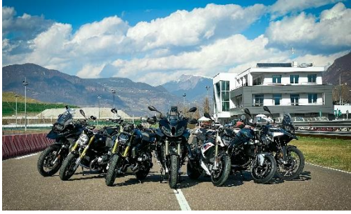
Abbildung 1: BMW Motorrad Test-Center Südtirol mit Motorradflotte. Ab der Saison 2024 mit brandneuen Modellen wie der R 1300 GS