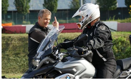
Abbildung 2: Individuelles Feedback und professionelle Trainingsanleitungen durch BMW zertifizierte Instruktoren