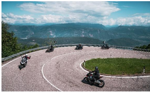
Abbildung 4: Unmittelbarer Zugang zu den Dolomiten für spektakuläre Tourerlebnisse