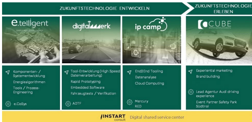
Bild 1 Die INSTART group besteht aus fünf hochspezialisierten Unternehmen.