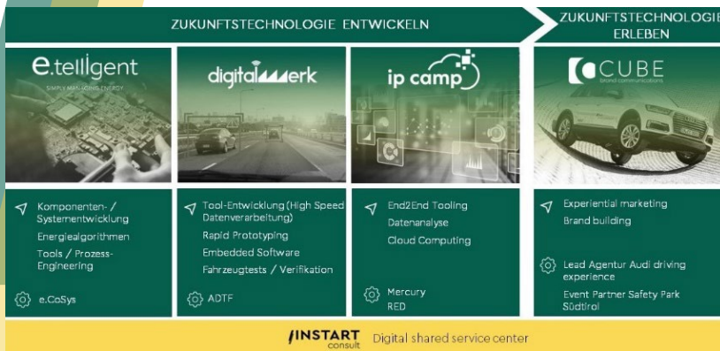
Bild 1: Die INSTART group besteht aus fünf hochspezialisierten Unternehmen.