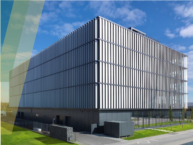
Bild 1: Das Headquarter der INSTART group in Ingolstadt